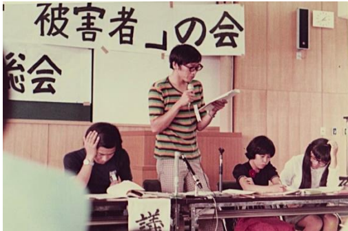
第2回全国総会 1973年8月19日

前回は、親達が総力を結集して恒久対策案を決定(72.8.20)したところまでをお知らせしました。今回は、その後のことです。恒久対策案は、経過的には森永乳業の作成した恒久措置案に対抗して作られたものです。